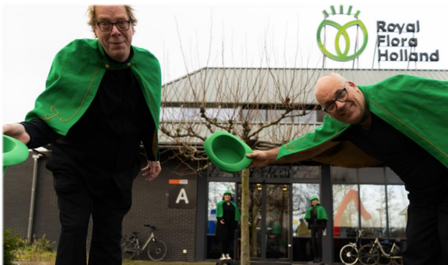
Beursvloer 2020: welkom door acteurs van Auth&Tiek.

Heeft u interesse of wilt u meer weten? Wij zijn bereikbaar via info@harentynaarloseuitdaging.nl en tel. 0649387050. Van harte welkom!